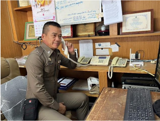
พนักงานวิทยุ ๒๔ ชั่วโมง ให้ข้อมูล