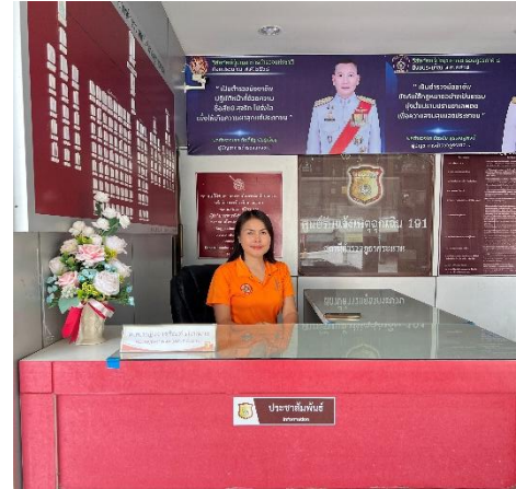
เจ้าหน้าที่ประชาสัมพันธ์ประจำสถานี